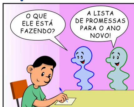
415 - PROMESSA DE ANO NOVO